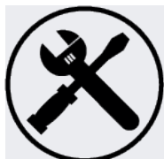
Inklusive Montageanleitung: einfacher Aufbau.