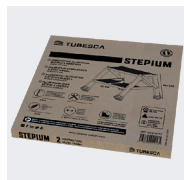
Produkt in einer Verpackung geliefert.