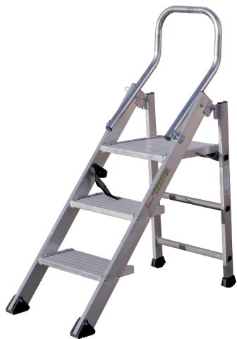
Modèle 3 marches

Le marchepied Confort pliant XL dispose de marches extra larges et d'une plate-forme de 400 x 400 mm avec une structure renforcée faisant de lui un "escalier mobile repliable". Ses surfaces striées et ses sabots antidérapants procurent une sécurité optimum. Des roues de déplacement sont disponibles en option. Il est conforme à la norme EN 14183 et au décret 96 333. Disponible en version 3 marches avec une hauteur d'accès maxi de 2,70 mètres.