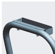
Option porte-outils (02374699)