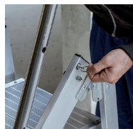
Blocage du garde-corps