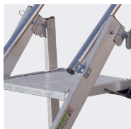
Grande surface du repose-pieds 400 x 400 mm