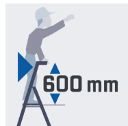
Maxi sécurité anti-basculement avant