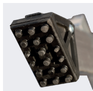
Sabots articulés 100 x 55 mm