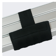
Asas de confort, para facilitar el transporte