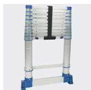
Estabilizadores retráctiles para los modelos de 3,20 / 3,80 y 4,40 m