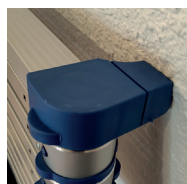
Conteras de apoyo, para una estabilidad perfecta