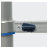
2 pulsadores para replugar la escalera