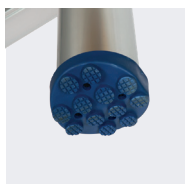
Tacos antideslizantes, para asegurar la estabilidad del modelo 2,90 m