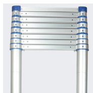
Altura ajustable según las exigencias de la obra