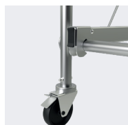
Ruedas de Ø 125 mm. Bloqueo ultra potente de las ruedas.