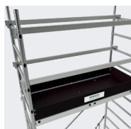
Montaje rápido sin herramientas