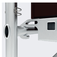
Ganchos de las plataformas ergonómicos