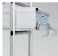
Ganchos de las plataformas ergonómicas