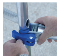
Sistema de enlace Ergoblock® patentado, fijación de los estabilizadores y barandillas